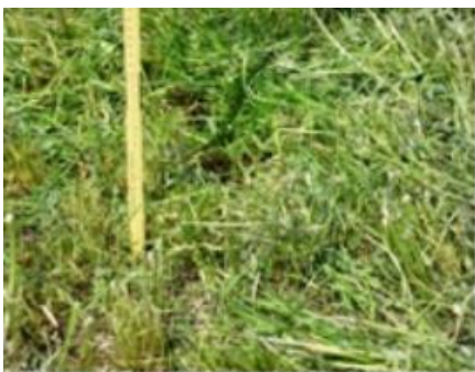
Coupe normale 6 à 7 cm