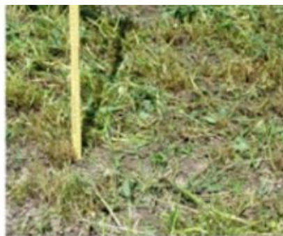
Coupe basse 3 cm