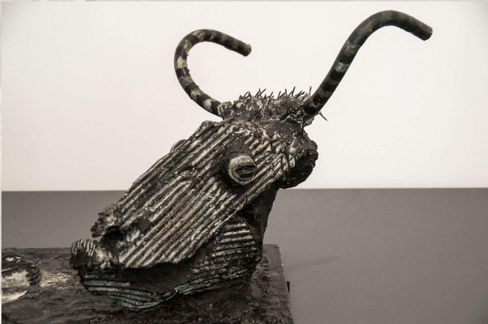
Xavier POUQUET cabinet vétérinaire Les CHARMILLES, SECONDIGNY 79130