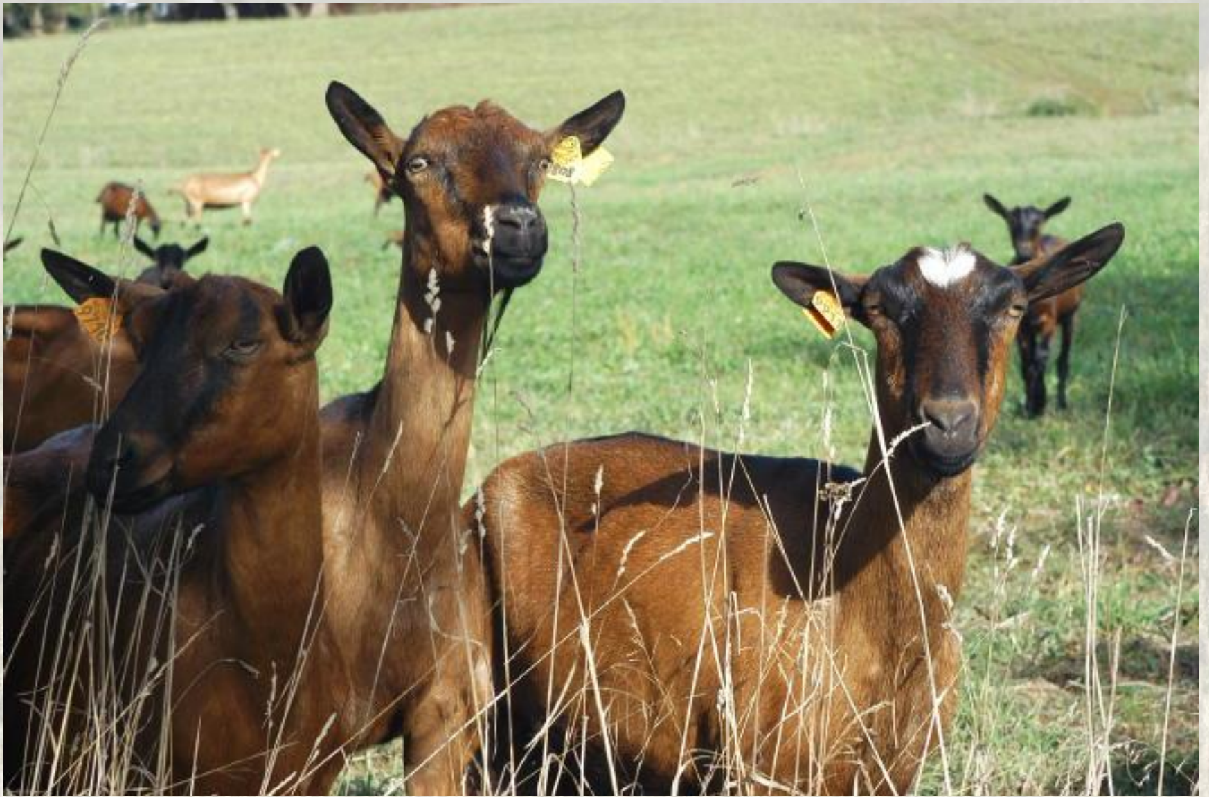
Xavier POUQUET cabinet vétérinaire Les CHARMILLES, SECONDIGNY 79130